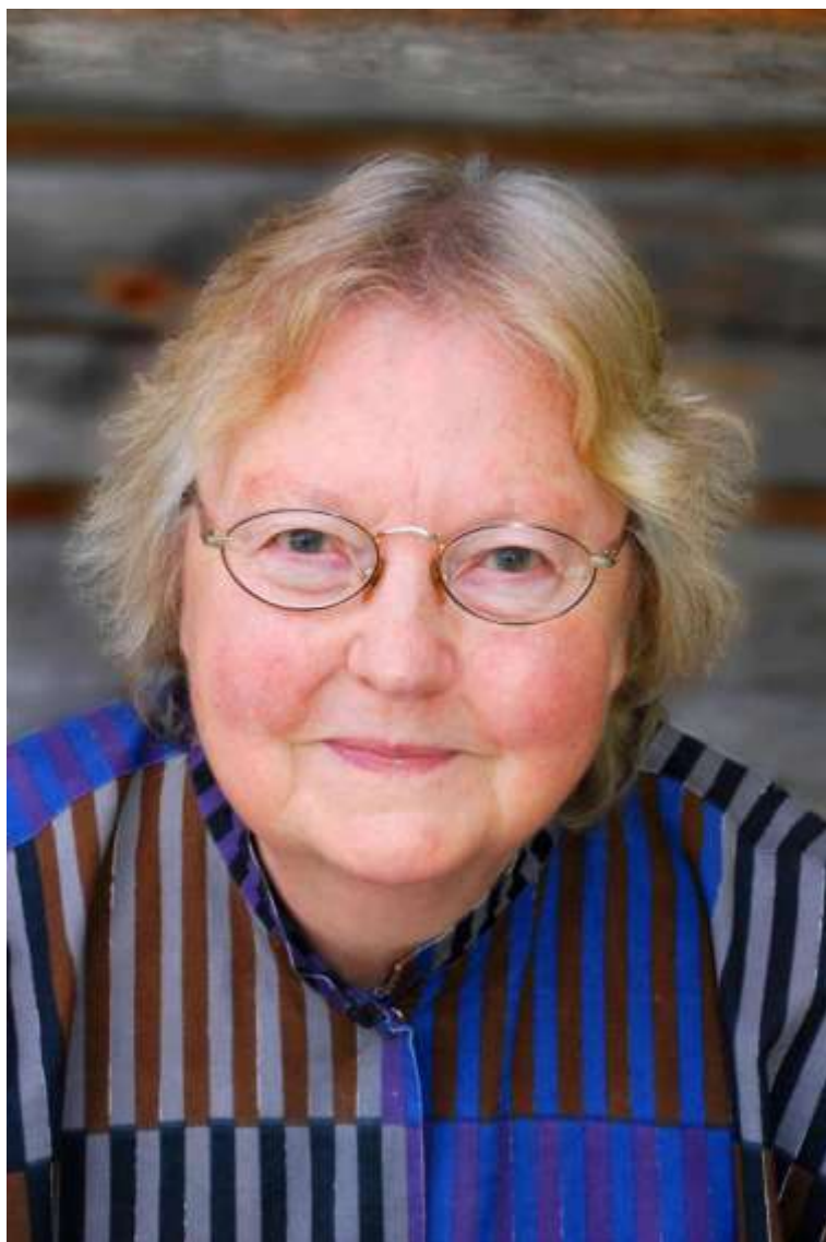
Birgitta Hambraeus 2008.

Birgitta Hambraeus var riksdagsman för Centerpartiet 1971-1998. År 2000 fick hon Centerpartiets högsta utmärkelse, Bramstorpsplacketten, "För banbrytande gärning".