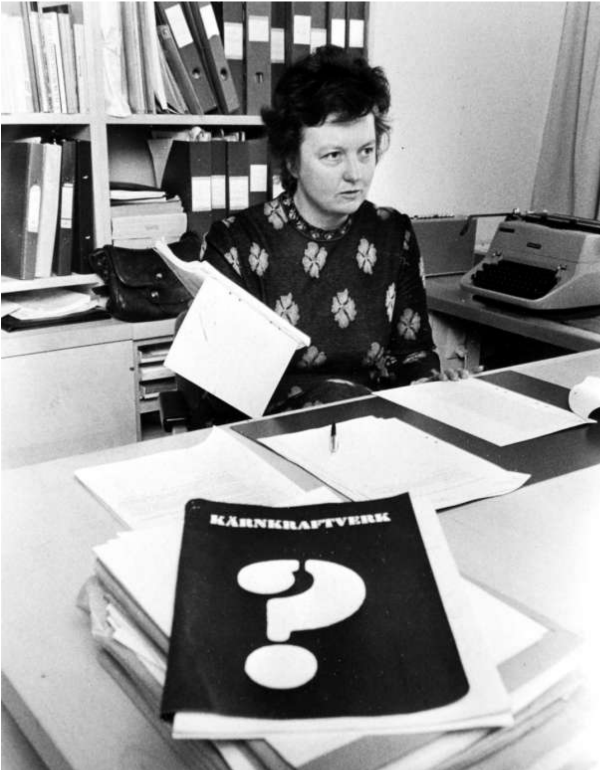
Kärnkraft ? 1972