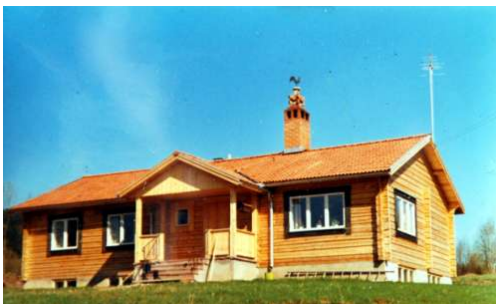
"Prästgården" i Hornberga 1969