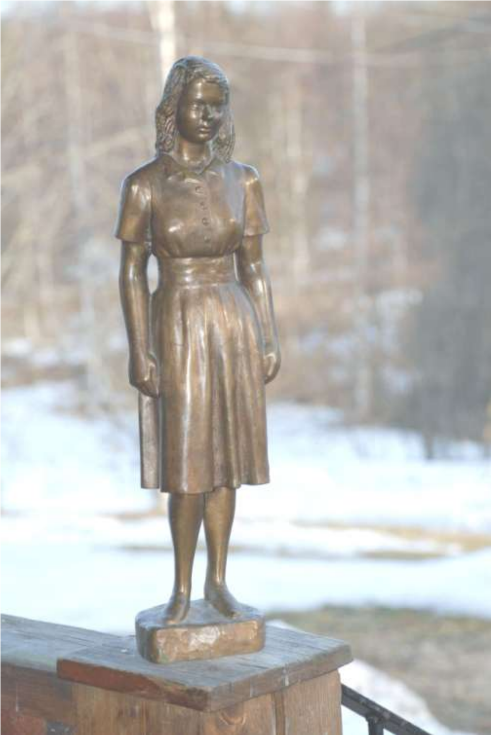
Statyett i brons av Birgitta 1946, Torwald Alef